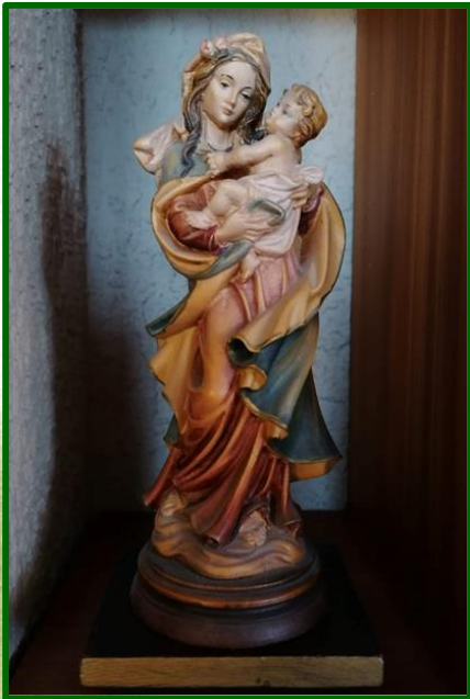
Hochzeitsgeschenk von Arbeitskolleginnen und -kollegen