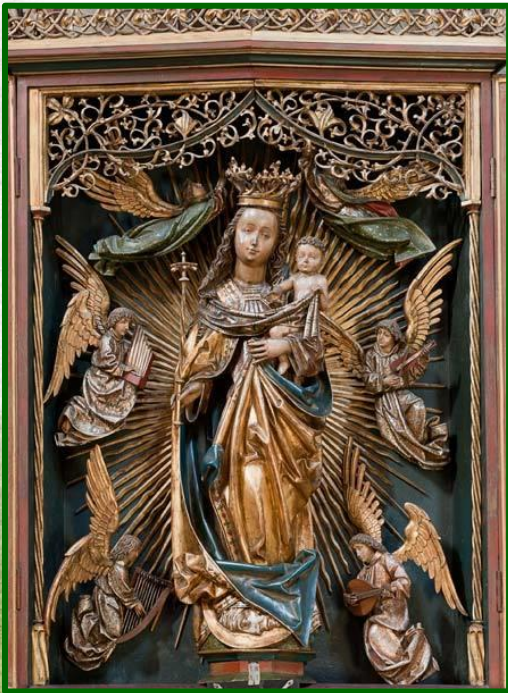
Mühlhausener Madonna im Bamberger Dom