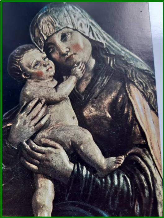
Mariendarstellung in der Pfarrkirche Maria Hilf in der Wunderburg