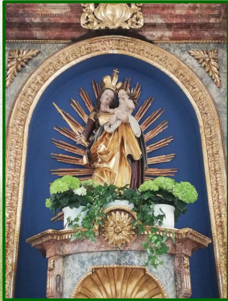
Marienfigur in der Pfarrkirche Maria Himmelfahrt Dankenfeld