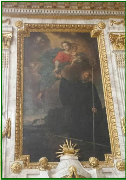
Klosterkirche Mariä Himmelfahrt Ebrach