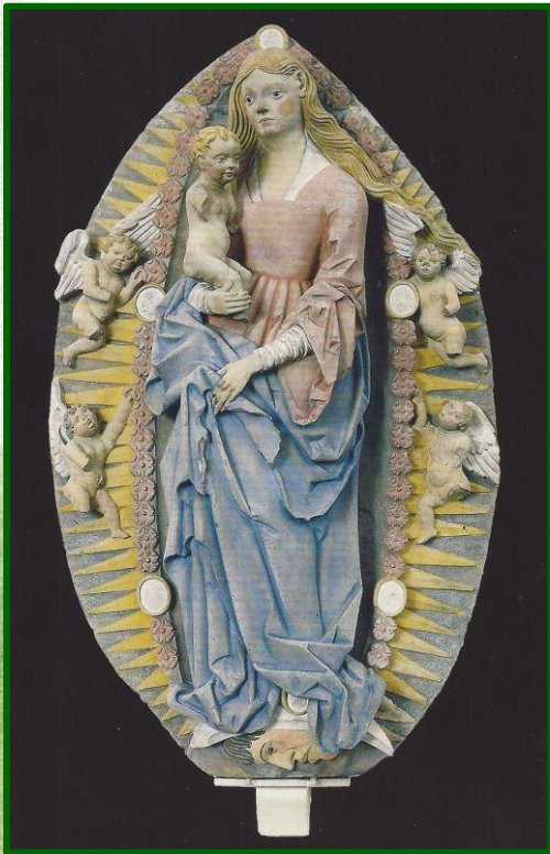
„Hörende Muttergottes im Rosenkranz“ aus der Basilika Weingarten

KDFB, Zweigverein Stöckach-Forth und Umgebung