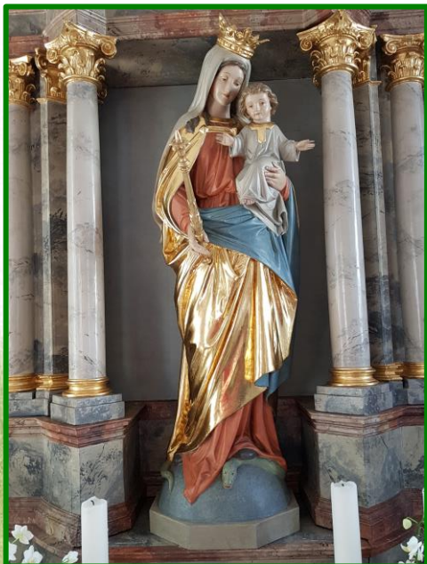
Mutter Gottes in der Kapelle von Frenshof